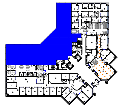
DR. FREDERIK-PHILIPS Plan Clé/ Key Plan